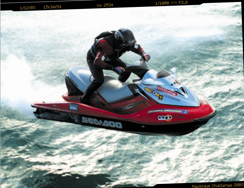
Nautique Challenge 2003